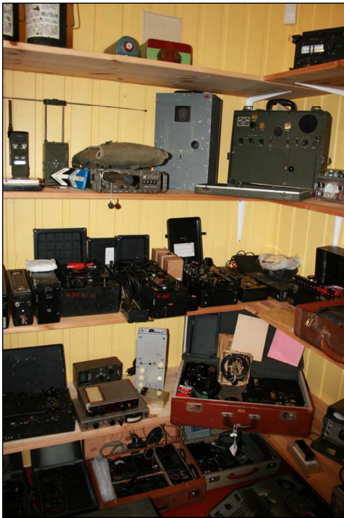
Agentsett og peileutstyr.