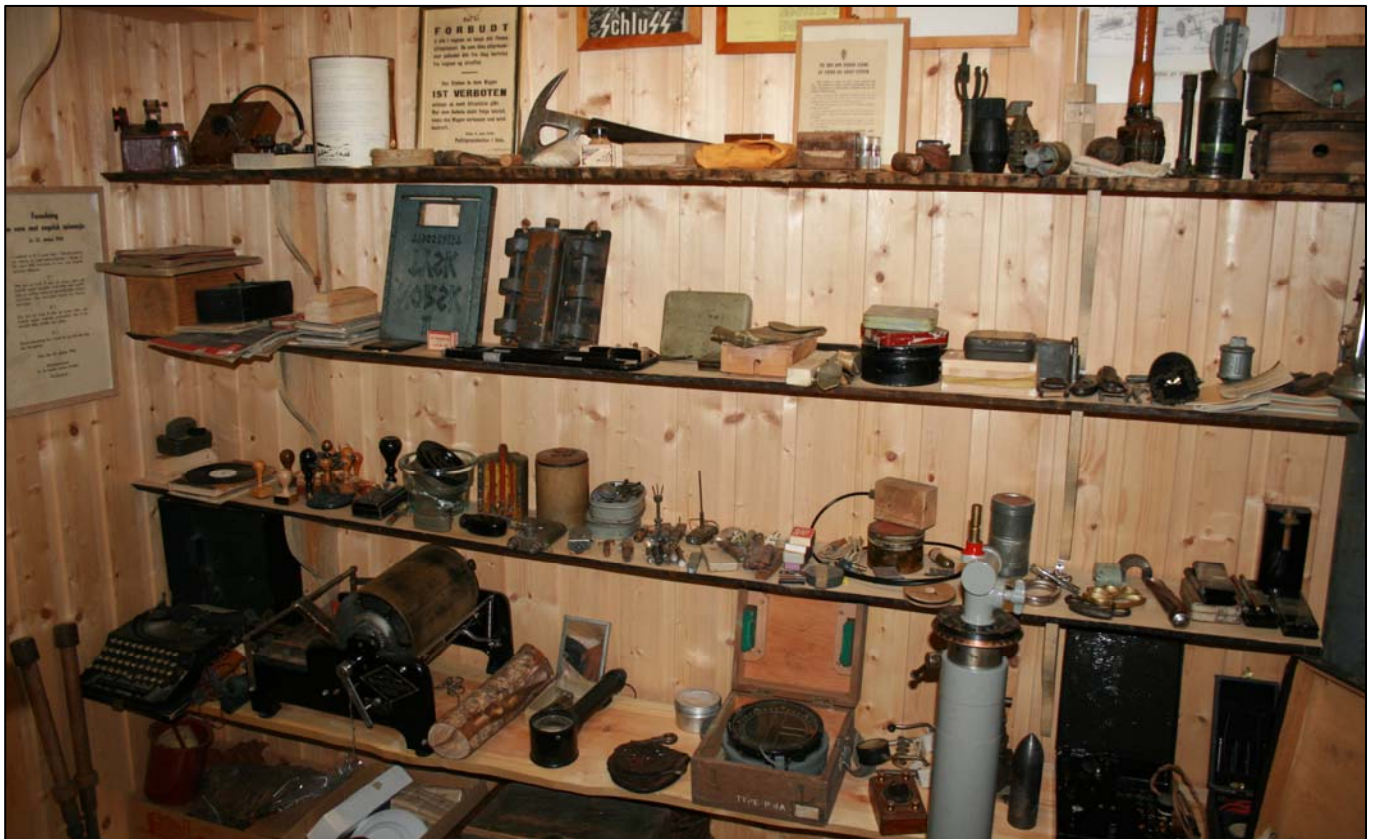
Sabotasjemateriell og annet fra 2VK.