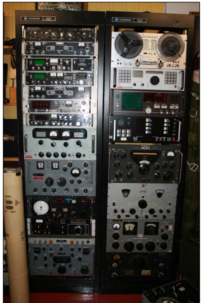
Rack fulle av kommunikasjonsmottakere av ulike årganger.