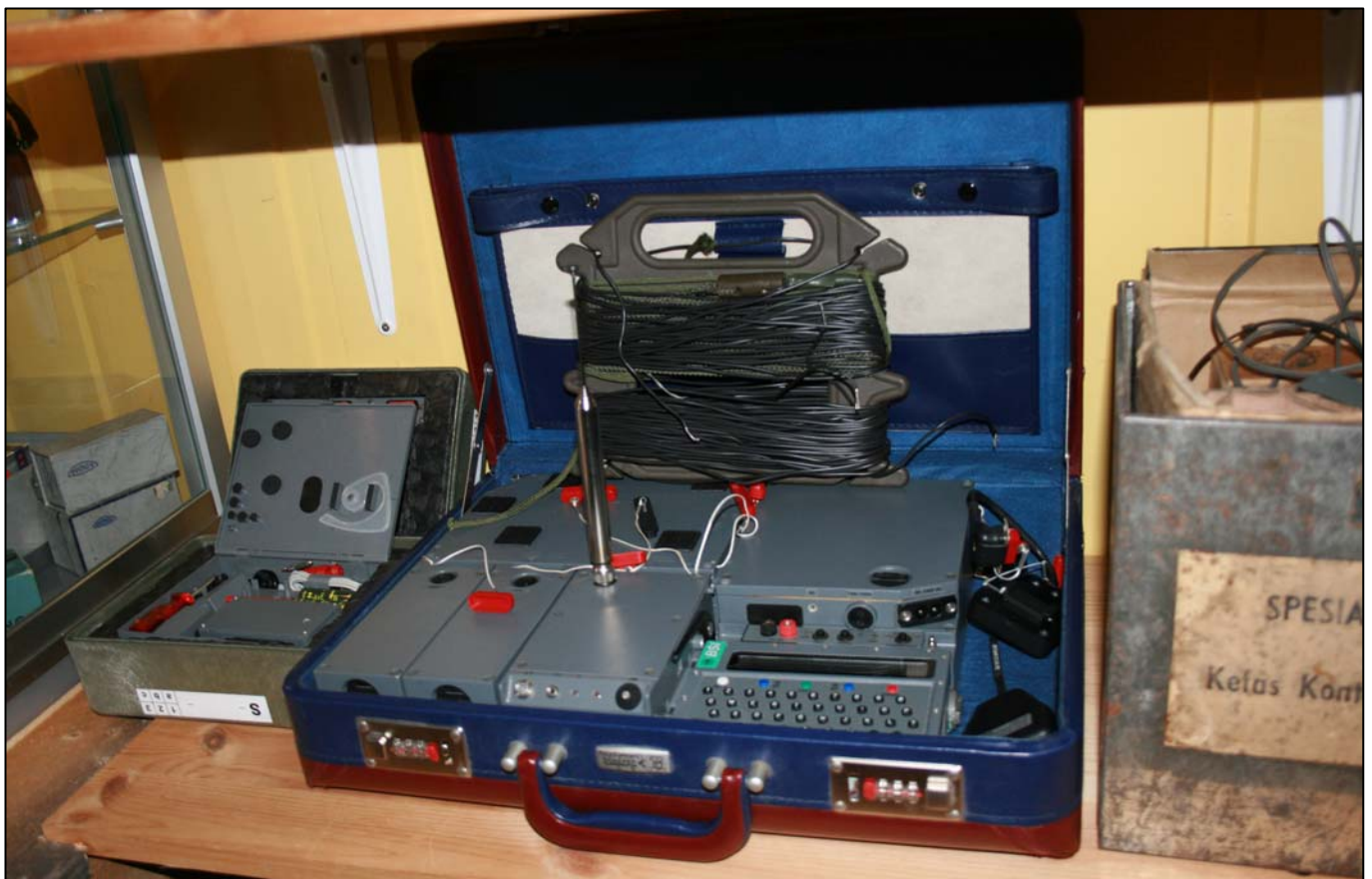
Agentsettet FS-5000 fra Bundes Nachrichten Dienst (BND) 1980.