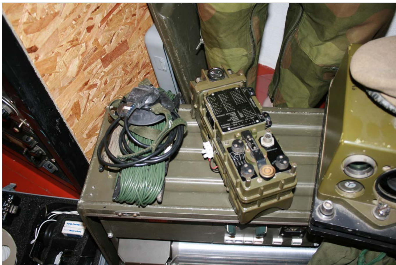
Clansman-set, RT-316, UK, 1976-2010.