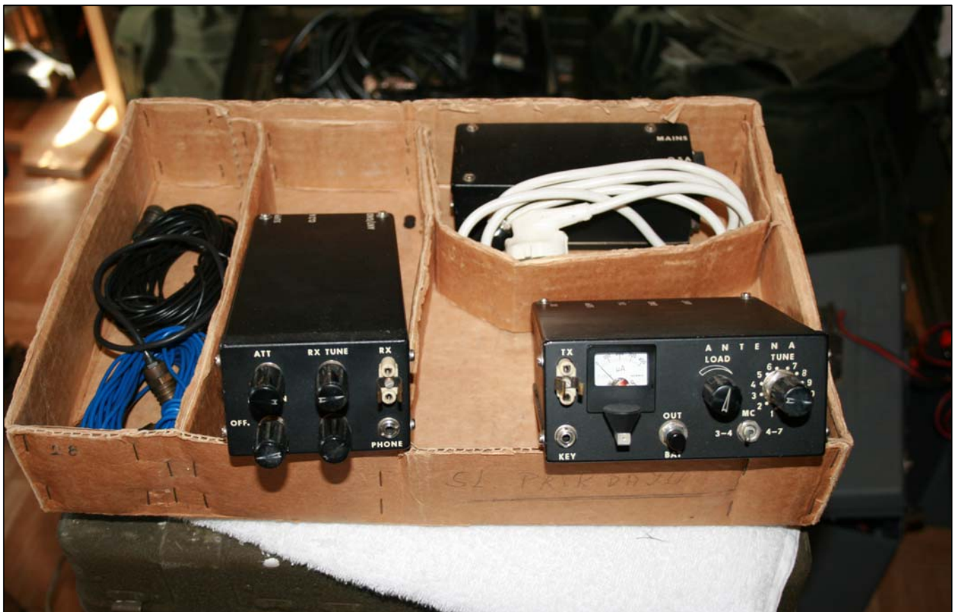
RTP8-SSB/3, fastfrekvens tx/rx, Checkoslovakisk produsert, 80-tallet.