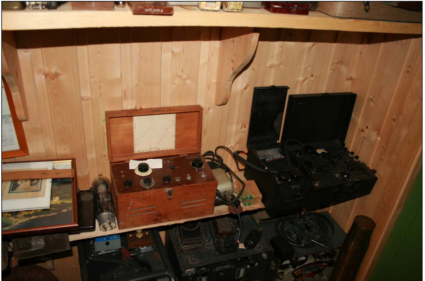
Mottakeren til Mk XV, (SIS, 2.VK).